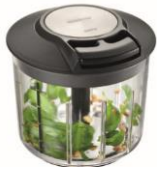
Multizerkleinerer SPEEDWING® Multi Chopper SPEEDWING®

· Mit Rezept · With recipe · Avec recette · Con ricetta · Con receta incluida · Met recept · С рецептом