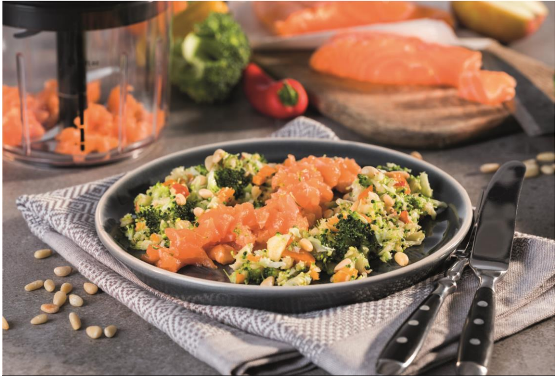
Lachstatar auf Brokkoli-Paprika-Salat